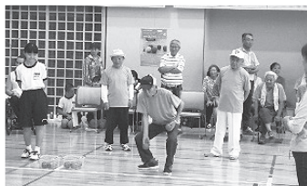
養護老人ホーム『チームひまわり』

7月13日(土)に開催された大会には、60チーム、総勢174名にご参加いただき、大いに盛り上がりました。また、養護老人ホームからは、「チームひまわり」として3名の入所者が参加しました。社会交流の一環にもなり、選手だけでなく応援に駆け付けた入所者も「楽しかった」と喜んでいました。