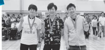
『デンソーモビシス開発』