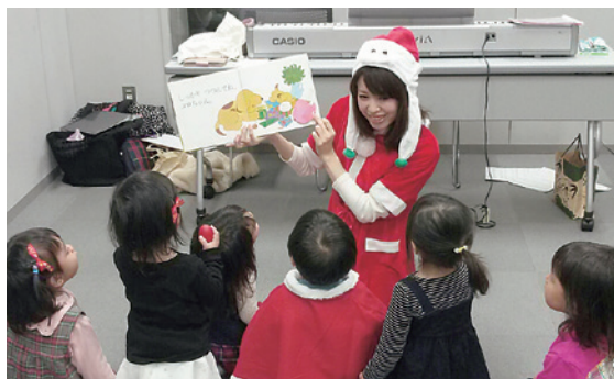
親子リトミック クリスマス特別レッスン