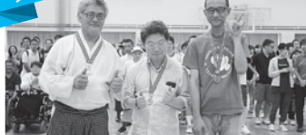
『デンソーグループハートフルフレンド(障害者施設を元気に)チーム』