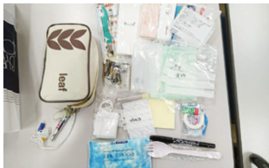
作成した防災ポーチ