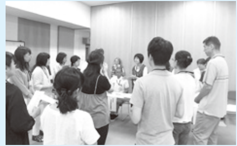
〈講座の様子〉コーディネート体験