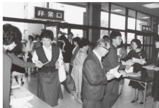
法人設立20周年記念式典の様子

内容 ：社会福祉法人刈谷市社会福祉協議会 法人設立50周年記念顕彰、「ふくし 写真コンクール」の最優秀賞及び優 秀賞の表彰など