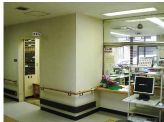
1階 受付事務所 (障害者支援事業所と兼ねる)