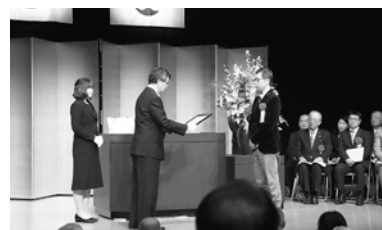
代表登壇者（アピタ刈谷店様）