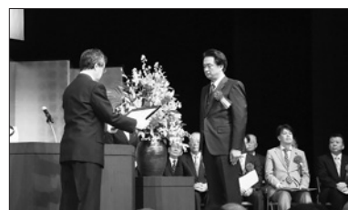
代表登壇者（刈谷ライオンズクラブ様）