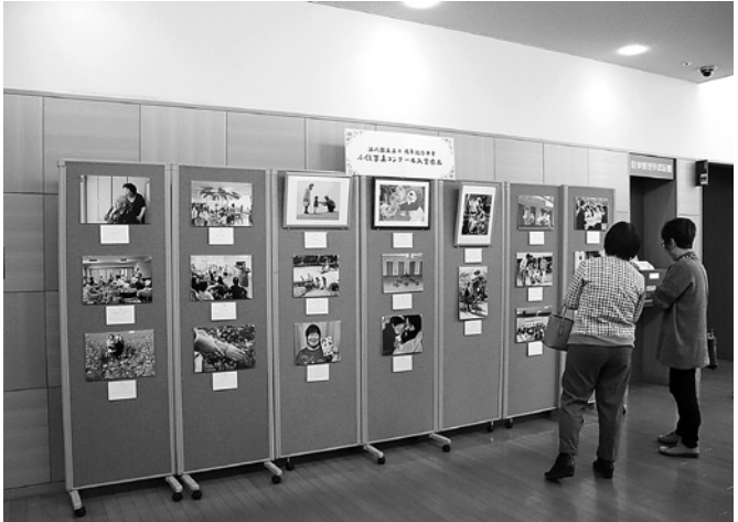
ふくし写真コンクール入賞者作品の展示