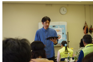
アイマスク体験 お弁当の説明を聞く