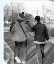
刈谷市地域支援事業 (移動支援)の様子