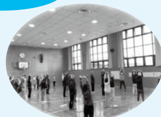
身体を動かす研修