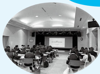
スキルアップ研修