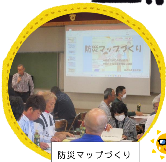
防災マップづくり

令和6年度は名鉄三河線西の中川町で開催します。地域の有志により、毎年綺麗なコスモス畑が見られ、多くのお客さんが訪れます。