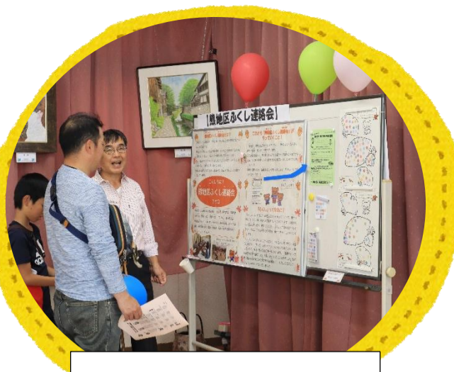
文化展でのふくし連絡会 PR

☀️ 地域のホットスポット：『熊地区夏祭り』 輪投げ等のこどもゲームや、グラウンドゴルフ体験、消火器の操作体験等こども達が楽しめるお祭りです。また、公民館のみでなく、熊老社会、自主防災会等のふくし連絡会所属団体、中学生ボランティアなど地域のみんなで作りあげのお祭りです♪