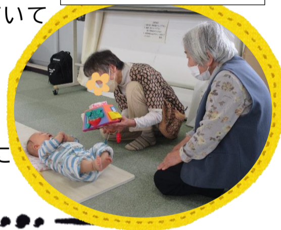
交流サロンホットとうぶ

毎月第4金曜日の10時から、刈谷東部市民館で子育て世代を対象とした「交流サロンホットとうぶ」を開催しています。いきいきクラブ会員にも参加してもらって、子どもたちに向けて紙芝居の読み聞かせを担当していただいています。