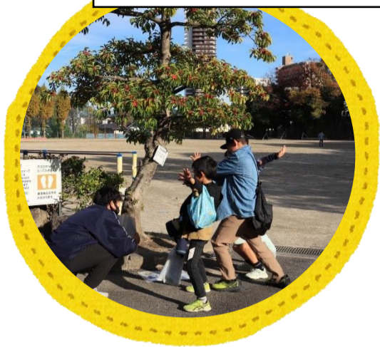
お宝さがしウォーキング