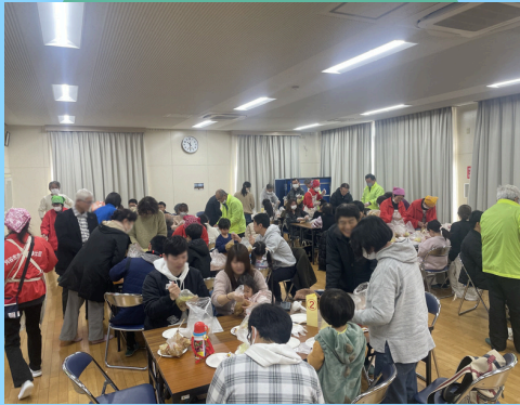
防災すごろくであそぼう