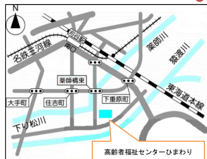
高齢者福祉センターひまわり

メール：vc.kyogikai@kariyashi.jp KARIYA SHAKYO 開館時間：月曜日から土曜日までの8時30分～17時 休館日：日曜日、国民の祝日・休日、 年末年始（12月29日～1月3日）